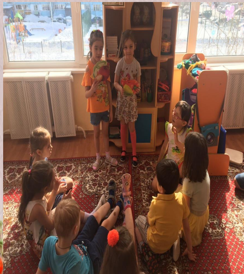
Беседа: Витамины - мои друзья