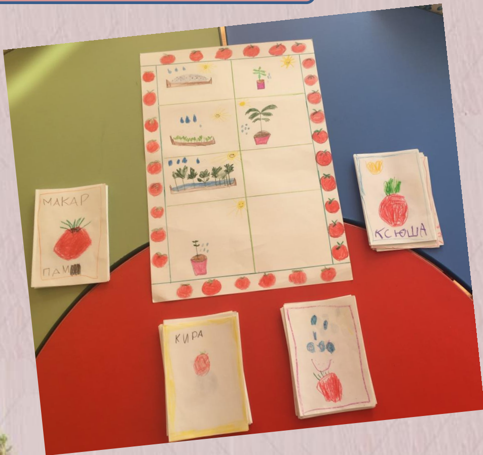
Дневник наблюдения за ростом