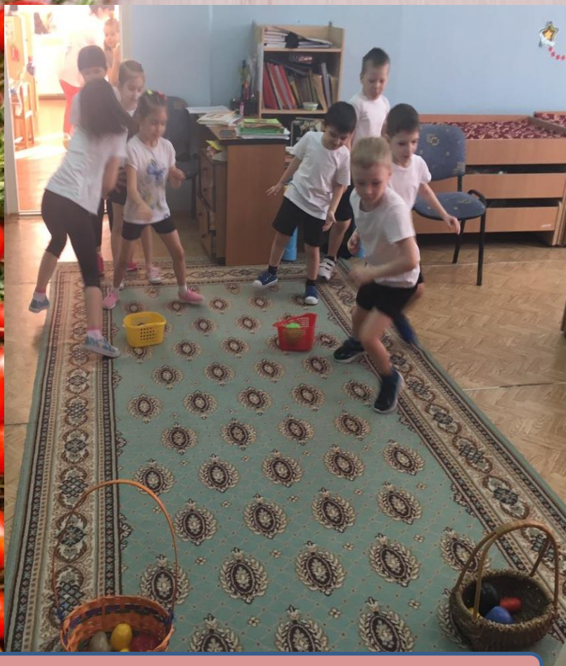
подвижная игра «Вершки и корешки».